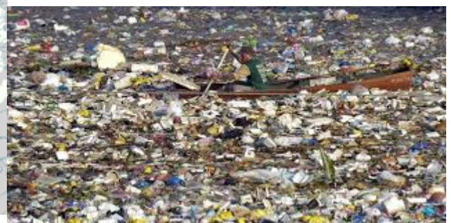
Photographie du septième continent